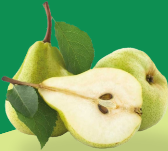
Pulpa Concentrada de Pera