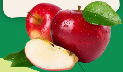
Pulpa Concentrada de Manzana