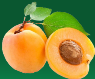
Pulpa Concentrada de Damasco