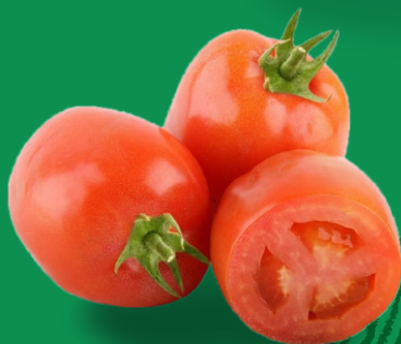
Salsa de Tomate