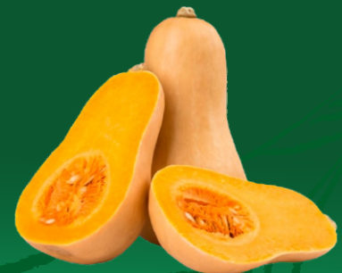
Pulpa Concentrada de Zapallo