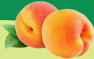
Pulpa Concentrada de Durazno