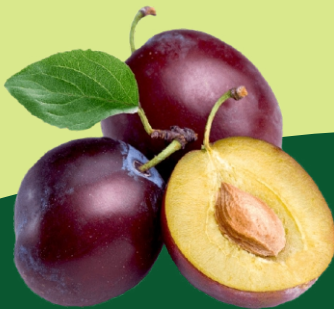
Pulpa Concentrada de Ciruela