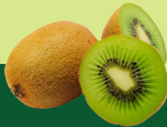
Pulpa Concentrada de Kiwi