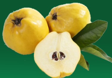
Pulpa Concentrada de Membrillo