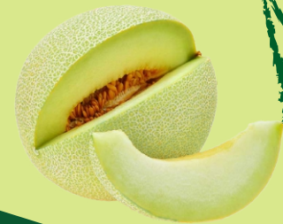
Pulpa Concentrada de Melón